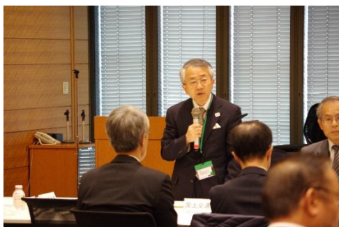
(冒頭挨拶をする島倉副会長)