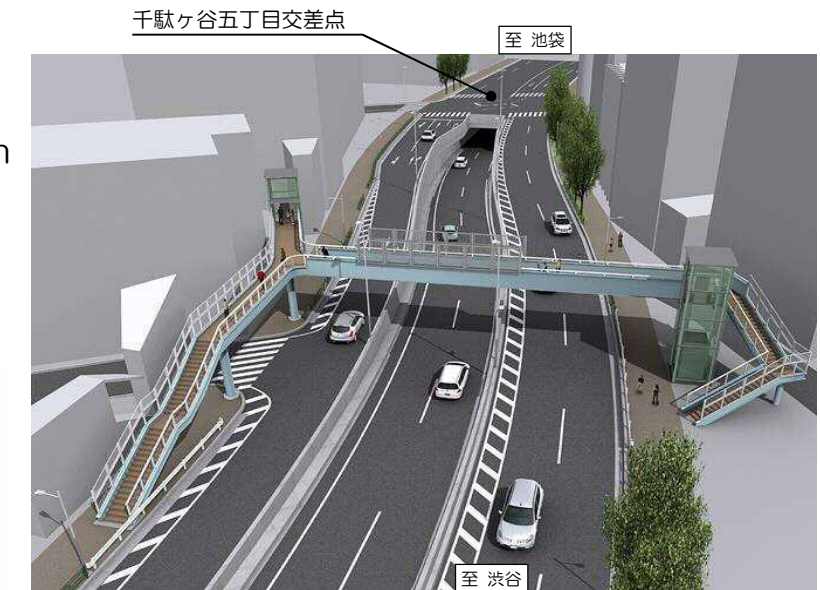
▲ 完成イメージ図 (千駄ヶ谷五丁目南交差点付近から池袋方面を望む)

沿道の皆様には、ご不便をおかけいたしますが、ご理解とご協力を賜りますようお願い申し上げます。