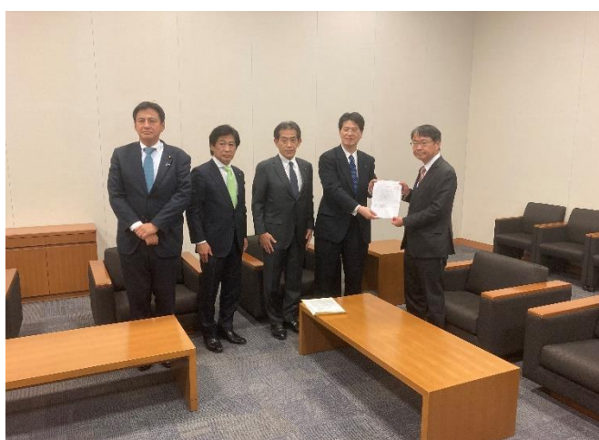
(総務省・川窪自治税務局長への申入れ)