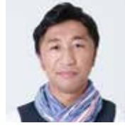
内藤 大助さん 元WBC世界フライ級王者