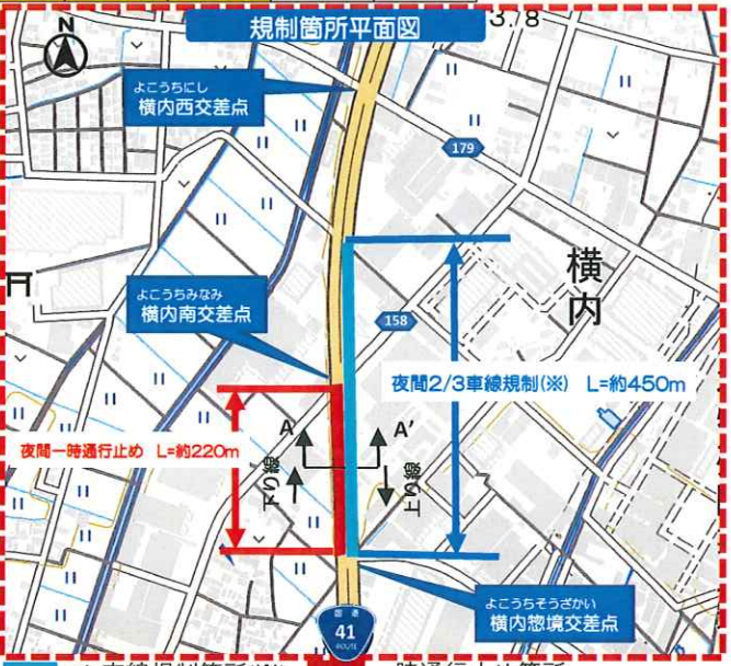
(国土地理院標準地図に地名、範囲を加工掲載)